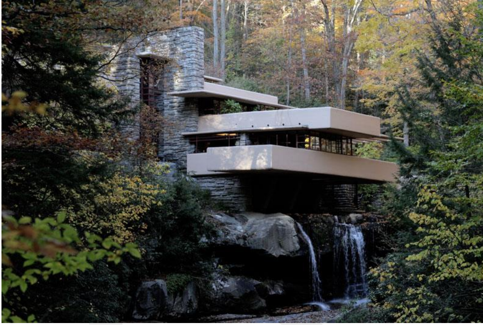
Şekil 1. Frank Lloyd Wright, Şelale Evi (Falling Water)

Doğanın insan yapımı çevredeki temsili kimi zaman bir mağara resmi, kimi zaman bir mimari motif, kimi zaman da bir bahçe olarak kendini göstermektedir. Mimari literatüre girmiş en belirgin biyofilik tasarım yaklaşımlarından biri, 20. yüzyılın ilk yarısında yüzyıla da damga vuran Frank Lloyd Wright tarafından tasarlanmış olan Şelale Evi'dir (Falling Water) (Şekil 1). Bu bakımdan yaşam ve doğaya genetik olarak kodlanmış ve doğuştan gelen eğilim olarak tanımlanan biyofili kavramı yapıyı çevre kuramı içinde zaten mevcuttur.