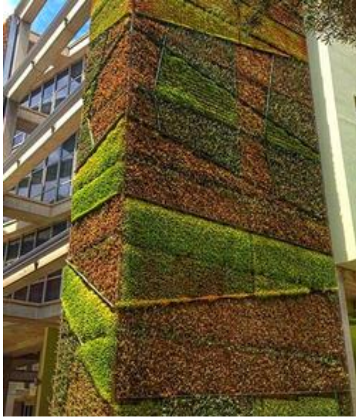
Şekil 3. İzmir Ekonomi Üniversitesi, Güzel Sanatlar ve Tasarım Fakültesi

Yapılı çevre içine peyzaj unsurlarının dahil edildiği bir başka belirgin örnek ise son dönemde özellikle kentsel yeşil alanların azalması ile tüm dünyada yaygınlaşan çatı bahçeleridir. Bu uygulamalar, özellikle bireyin iyi olma haline doğrudan etki sağlayan kentsel rekreasyon alanları için yeni seçenekler sunmakla beraber binaların fiziksel çevre kontrolü anlamında da birçok olumlu getiri sunuyor.