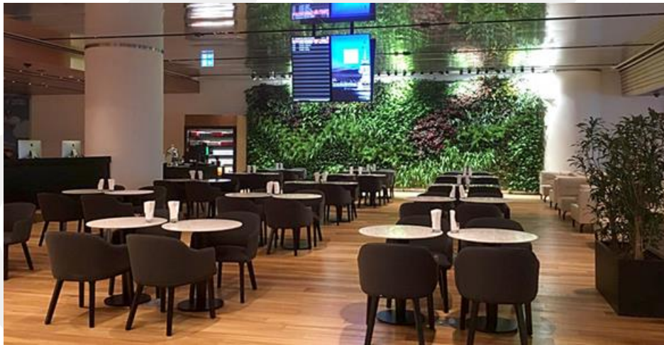
Şekil 2. İstanbul Uluslararası Havalimanı, CIP Lounge

Günümüzdeki çağdaş uygulamalar gözetildiğinde, biyofilik tasarım yaklaşımının iç mimarideki pratiğinin en çok büyük ofis yapıları ve kamusal yapılarda mekana doğayı katmayı ya da başka deyişle mekan kurgusuna peyzaj unsurlarının dahil edilmesinin benimsendiği uygulamalarla karşılaşmaktadır. Bu yola kullanıcı açısından daha konforlu, refah düzeyi yüksek ve iyileştirici mekanların oluşturulması ile kullanımına yönelik birçok kazanımın sağlanmaktadır. İçmimari çözümlerde biyofilik tasarım yaklaşımı açısından izlenen ilk yol açık, ferah ve doğaya yönelen iç mekanlar oluşturabilmektir. Burada temel fikir mekana sokamadığı durumlarda mekanı peyzaja döndürmek, mümkün olan en geniş manzara görüntüsünü mekan kullanıcılarına sunabilmektir. Bu algıyı destekleyecek şekilde de mekana küçük ölçeklerde ama devamlı bitki ve benzer peyzaj unsurlarını dahil edilmektedir. Bu yaklaşımda daha düşük enerji kullanımı için gün ışığını etkin kullanma, doğal havalandırma ile mekandaki ısı konforunu kontrol edebilme ve ses-koku gibi diğer duyuşsal bağlarla yaşam dostu yeni mekanlar ortaya çıkarılmasını hedeflenmektedir. İç mekanda şelale, havuz, akan su gibi farklı uygulamalarla su unsuru kullanımı, yeşil duvarlar (düşey bahçeler) ve doğaya gönderme yapan renk tercihleri dikkat çekmektedir (Şekil 2).